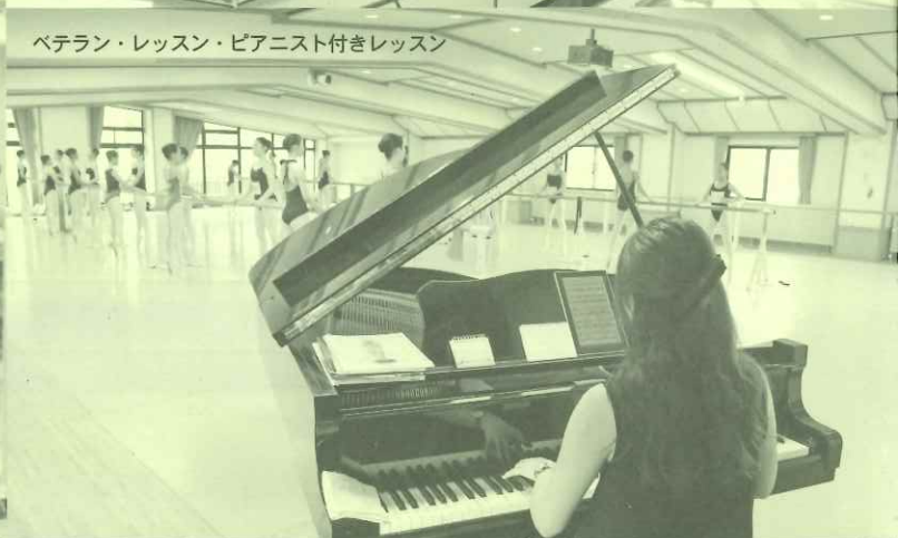
ベテラン・レッスン・ピアニスト付きレッスン