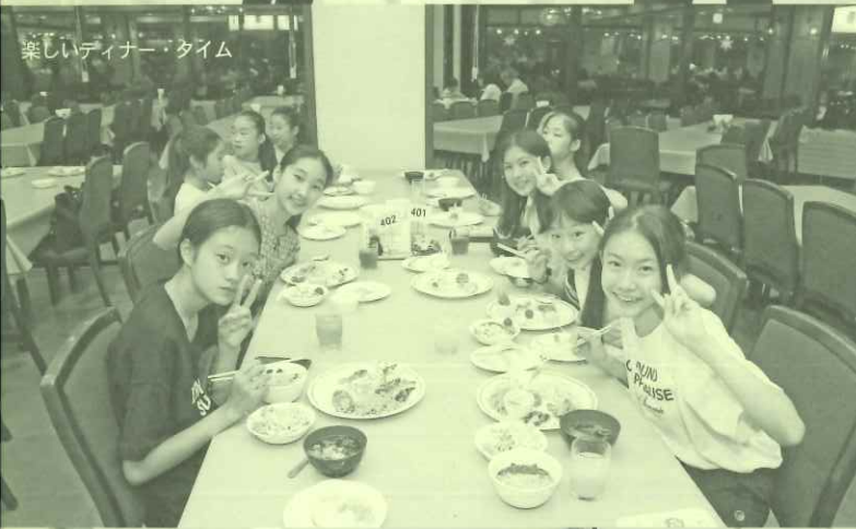
楽しいディナー・タイム