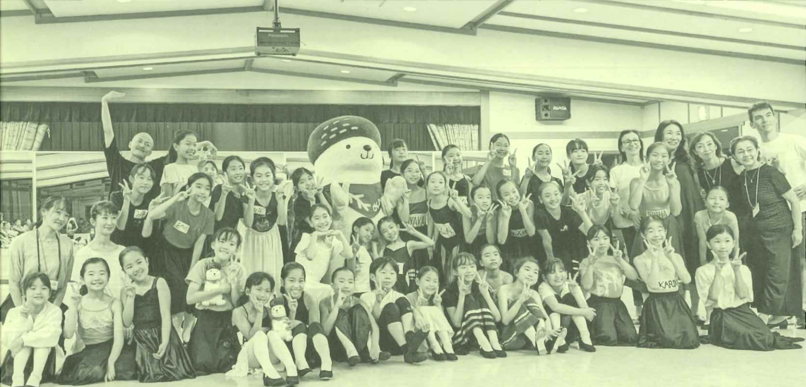
全員受講認定証を頂きました！