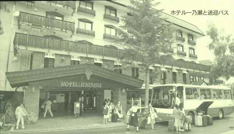
ホテルー乃瀬と送迎バス