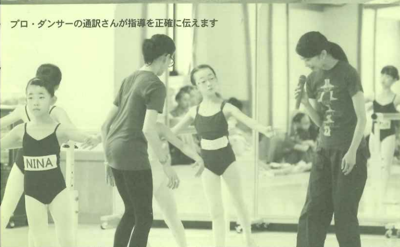
プロ・ダンサーの通訳さんが指導を正確に伝えます