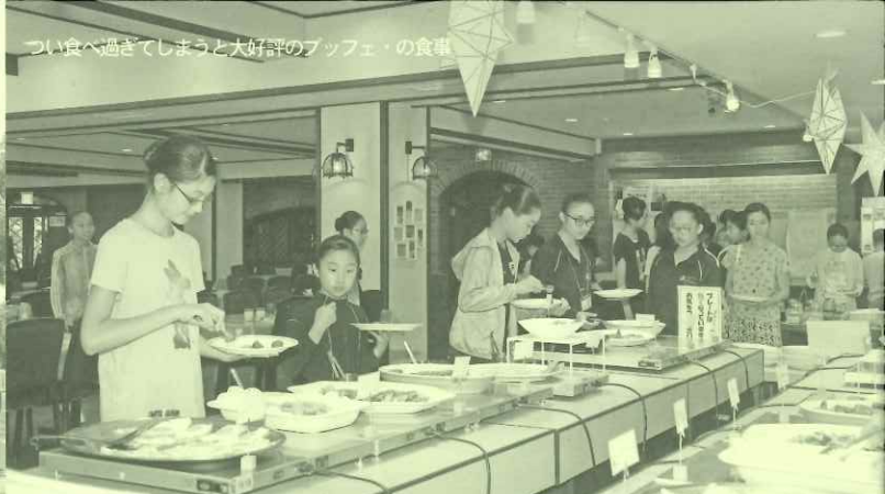
つい食べ過ぎてしまうと大好評のbuffetの食卓